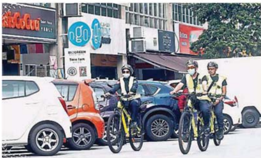
蒲种再也市脚车执法队不定时在蒲种公主城第二区商业区巡邏, 一旦发现违例停车或双重停车的车辆, 就会开出罚单给他们。