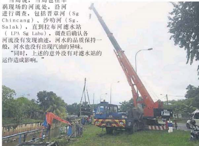
■撞入河流中的车辆是在今午被吊离河流。