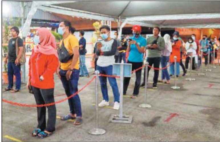
莎阿南上城市集划下1公尺线，确保访客排队时保持安全距离。