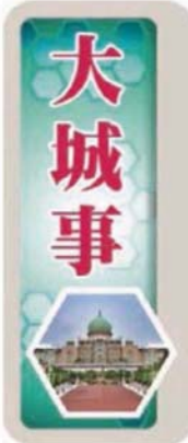
地點：無拉港斯里布萊組屋