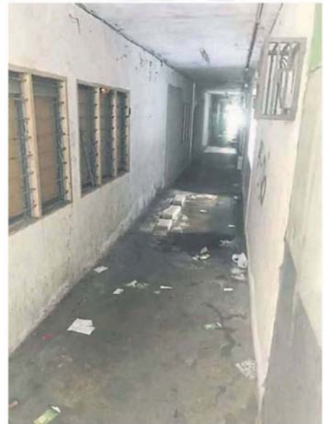
■其中一座组屋走廊没灯，漆黑一片。