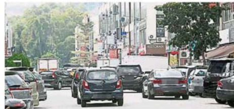
随着复原式行管令落实后, 蒲种公主城第二区商业区再次出现停车位不足及双重停车问题。

部分驾驶者因贪图方便, 随意将汽车双重停泊在路边, 孰不知该举动会阻碍交通, 让经过的车辆不得不放慢行驶车速。