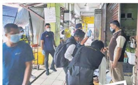
■禁止聘请外劳的新政策，暂时还不包括私人商店和食肆。