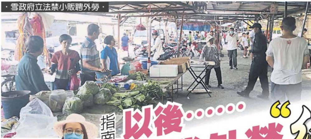
· 雪政府立法禁小販聘外勞 ·

Provided for client's internal research purposes only. May not be further copied, distributed, sold or published in any form without the prior consent of the copyright owner.