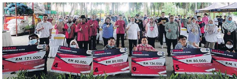
Ahmad (tengah) bergambar selepas menyampaikan geran berjumlah RM516,000 kepada 31 Agropreneur Muda pada program JAM Negeri Selangor di Pusat Pengumpulan Hasil Pertanian Kuala Langat semalam.

Timbalan Menteri Pertanian dan Industri Makanan I, Datuk Seri Ahmad Hamzah berkata, menerusi penggunaan IoT, golongan agropreneur muda boleh menggunakan konsep smart farming atau pertanian pintar dalam tanam-