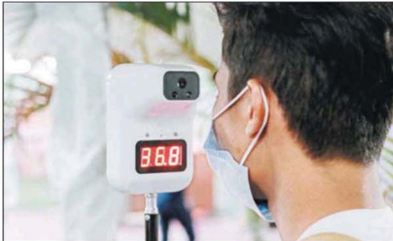
莎阿南上城的入口处设有智能体温测量仪，让所有商家和访客在进入市集前，先测量体温。