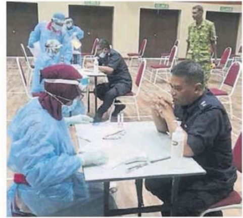
↑ 阿茲贊警監(前坐者右)到場接受冠病檢測。

“我們預計檢測報告於周五出爐。”他指出，前線人員必須進行病毒檢測，是為了確保眾人未受到感染，并可安全重返各自的工作崗位。