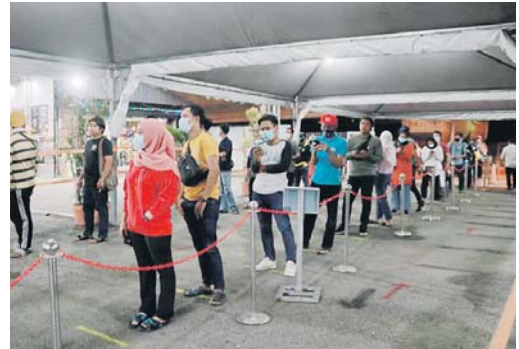
Uptown Shah Alam dibuka sepenuhnya kepada pengunjung mengikut SOP ditetapkan bagi mencegah jangkitan wabak Covid-19.

“Pengunjung dinasihatkan sentiasa mematuhi SOP yang telah ditetapkan serta elakkan membawa golongan berisiko bagi mencegah jangkitan Covid-19,” katanya.