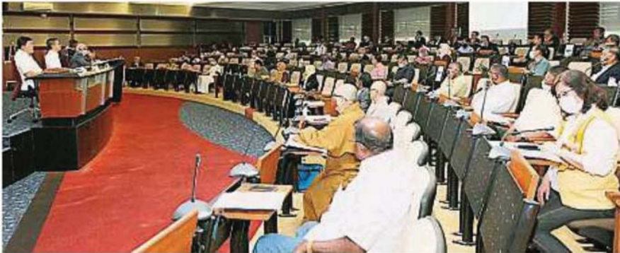
出席雪州非伊斯兰宗教团体举办防疫指南汇报会的宗教团体代表多达60人。

(巴生18日讯)雪州政府明起允许开放州内非伊斯兰宗教场所，特别制定一套附加防疫指南，惟现阶段70岁以上年长者不受鼓励到访。