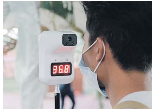
Seorang pengunjung menyaring suhu badan di pintu masuk Uptown Shah Alam.