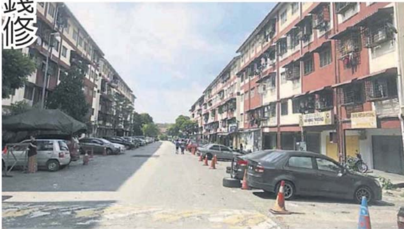
■斯里布萊组屋民生问题困扰居民多年。

他说，很多居民可能真的没办法负担每月的维修费，雪州政府若有组屋援助计划，希望州议员或市议员可以协助居民申请。