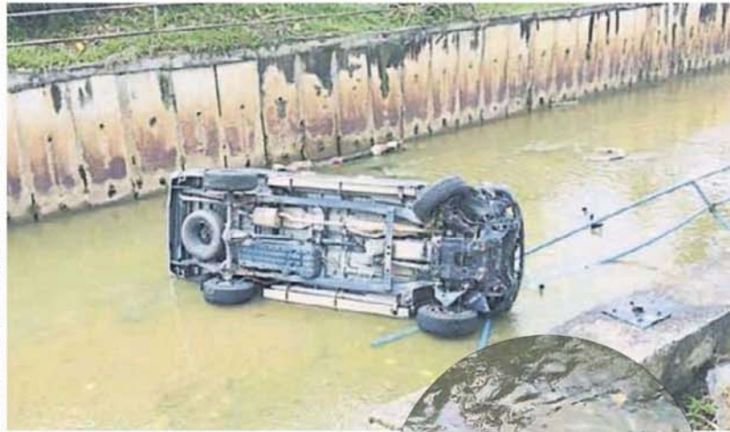
■峇当汝来河发生一宗车祸，一辆丰田Hilux货卡在意外中撞入河中。

(吉隆坡18日讯)一辆丰田Hilux货卡意外撞入河中，以致河水出现油迹，雪州水供管理机构展开调查后，确认从事发地点至滤水站的沿河一带没有出现污染情况，河水也没有出现汽油异味。