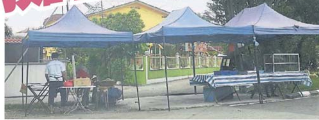
■路边摊一律禁止聘请外劳。