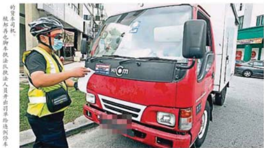
的警官司執 蒲种再也市脚车执法队执法人员开罚单给违例停车