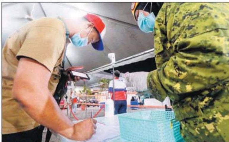
莎阿南上城除了提供使用SELangkah应用程序扫描二维码登记外，也提供簿子让访客写下名字、电话和体温记录。