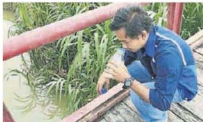
■当局也派人沿河进行调查，确认河水没有出现汽油的异味。