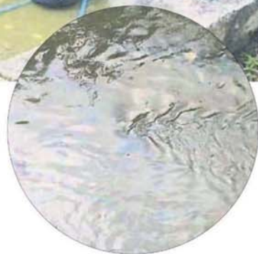
■河流有油迹出现，让当局担忧会影响距离数公里的滤水站运作。