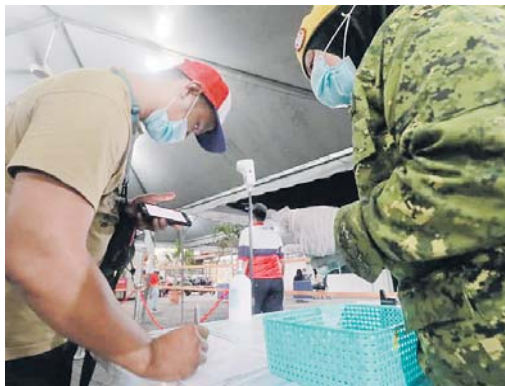
Pengunjung Uptown Shah Alam mencatat bacaan suhu dan maklumat diri.

“Pengunjung juga perlu menggunakan aplikasi Se-