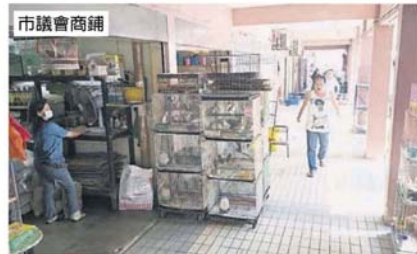
■新政策或把地方政府管辖的产业，也列入管制范围内，市议会的食肆、巴刹、商铺等都不能聘请外劳。