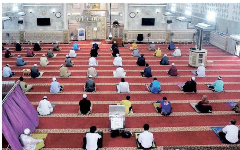
Jemaah solat Jumaat ditambah kepada 150 orang di 38 masjid di seluruh Selangor.

Bagaimanapun, katanya, semua surau di seluruh negeri Selangor termasuk Surau Kebenaran Solat